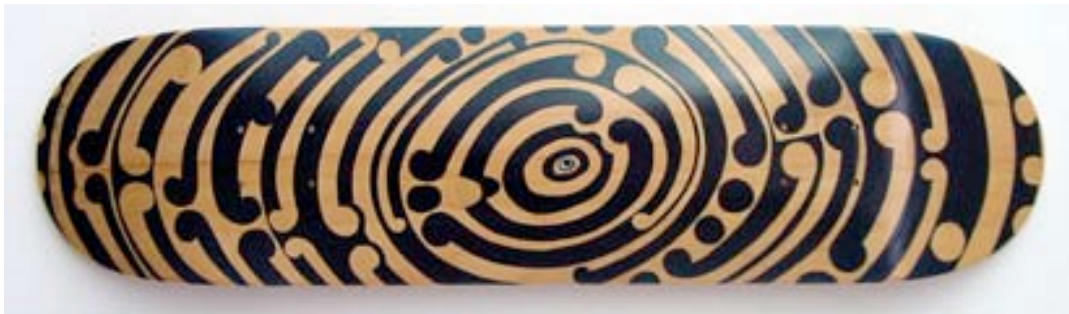
Michel Tuffery, Koru Bling Bling , 2004

Il 5 maggio 2006 è stata inaugurata a Cambridge (Inghilterra) la grande mostra Pasifika Styles , che celebra l'arte e la cultura Maori e delle isole del Pacifico (Fiji, Hawaii, Samoa, Tonga) prodotte in Nuova Zelanda.