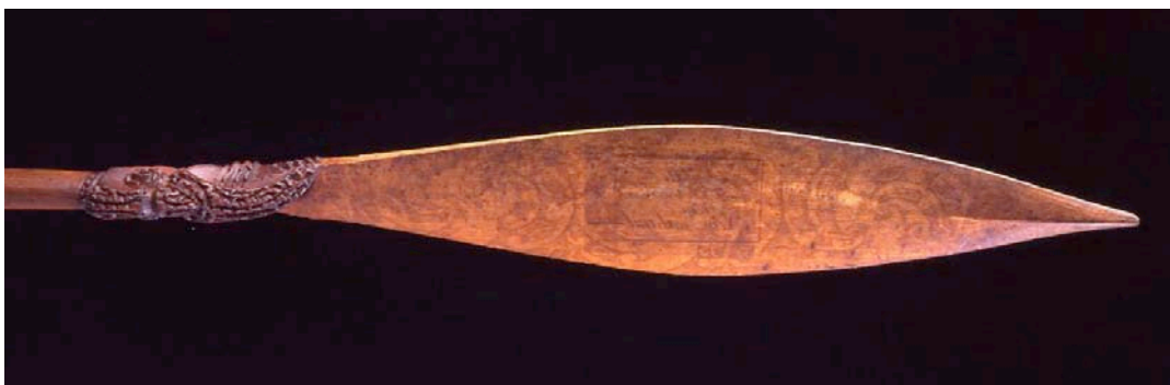
Remo Maori de Nueva Zelanda, recolectada por el Capitán James Cook en 1771. CUMAA D.1914.66

La exposición, que presenta el trabajo de artistas radicados en Nueva Zelanda junto con la incomparable colección Oceánica del Museo, está montada en el Museo de Arqueología y de Antropología de la Universidad de Cambridge (CUMAA) y permanecerá abierta al público hasta febrero 2008.