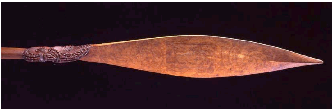
Rame maori de Nouvelle Zélande, collectée par le capitaine James Cook en 1771. CUMAA D.1914.66

Le musée d'archéologie et d'anthropologie de l'université de Cambridge (CUMAA) présente les œuvres d'artistes éminents de Nouvelle-Zélande ainsi que ses collections océaniques, renommées pour leurs qualité et valeur historique.