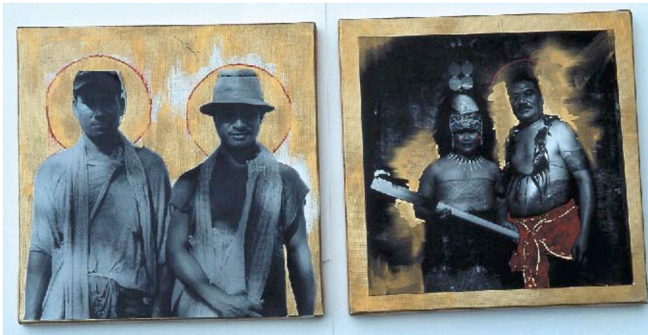
Greg Semu, Untitled, 2003

L' intensité de ces activités culturelles culminera en avril 2007, lorsque théâtre, musique et danse seront à l'honneur pour la semaine du « Festival des arts du Pacifique ».